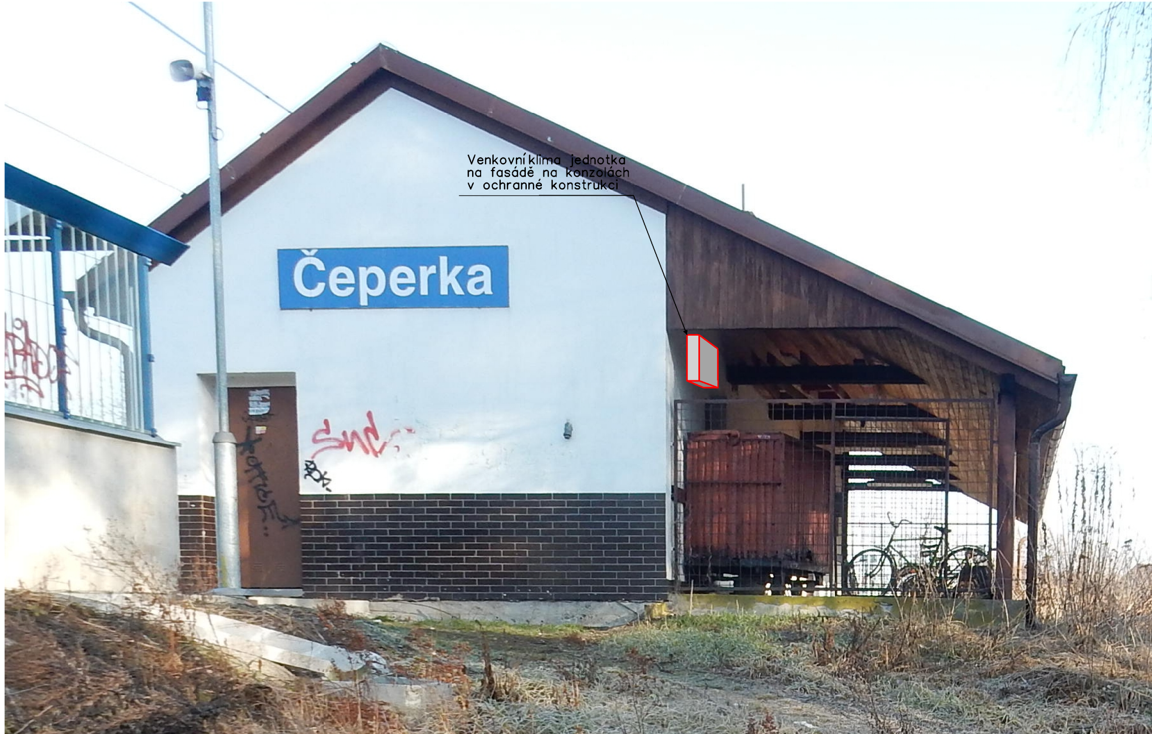
Venkovní klima jednotka na fasádě na konzolách v ochranné konstrukci